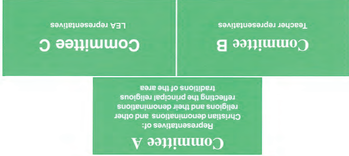
Each of these committees has equal voting rights (one vote per committee).